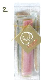
←4本アソート (味はおまかせ)