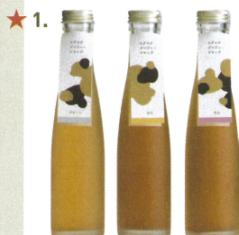
↑全3種(辛口、甘口、プレーン)から1種