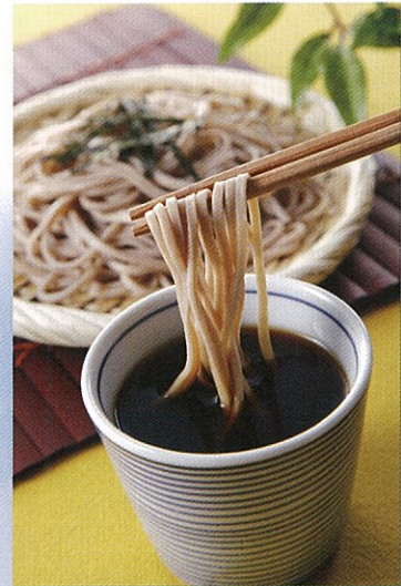
利賀そば (手打ち十割蕎麦)

主催 利賀村元気な地域づくり実行委員会 協力 南砺市商工会利賀村支部 南砺市観光協会利賀村支部 利賀村建設業協会