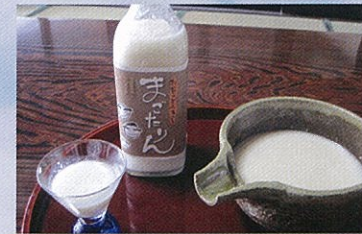
利賀どぶろく まごたりん

利賀の飲食店、民宿、温泉は元気に営業中！ ミニかまくらと特産品販売で、皆様をお待ちしております。