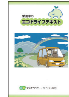
▲エコドライブテキスト 乗用車版 (200円/冊)

当財団で作成したエコドライブテキスト(乗用車版、トラック版、各200円/冊)、「エコドライブ10のすすめ」チラシ・ポスター(無料)、コンクールリーフレットの表紙(電子データ)、優秀取組事例集(電子データ)、燃費管理ツール(ウェブサイト)、参加証明書(電子データ)などを用意しています。