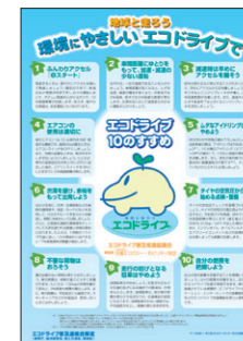
▲エコドライブチャレンジ (無料)