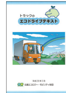
▲エコドライブテキストトラック版 (200円/冊)