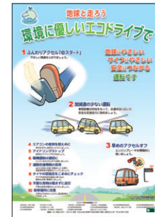
▲エコドライブポスター (無料)