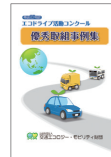
▲優秀取組事例集 (電子データのみで提供) (無料)