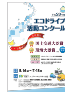
▲コンクールリーフレット (電子データのみで提供)