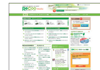
▲燃費管理支援サイトReCoo (無料/別途登録必要)