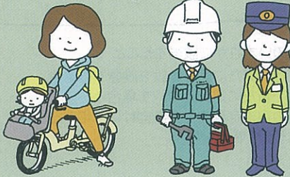
パートタイム勤務