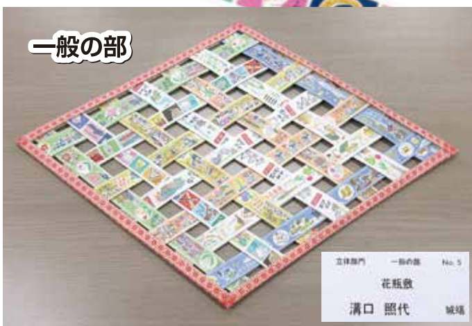
立体部門 一般の部 No. 5 花瓶敷 溝口 照代 城端