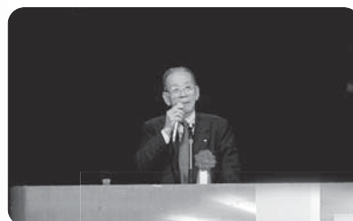
石澤全国連 会長の講演